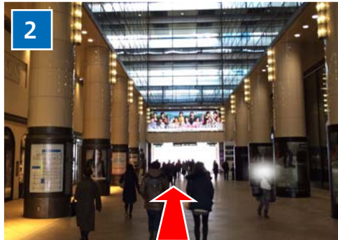
左側にルミネ、右側に阪急メンズ館のビルのトンネル(有楽町マリオン)をくぐり出ます。