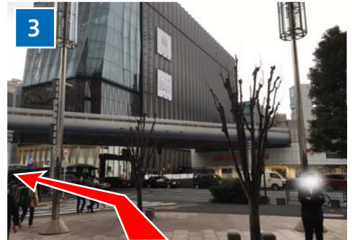
トンネルを出て左へ。 数寄屋橋交差点方面へ向かいます。