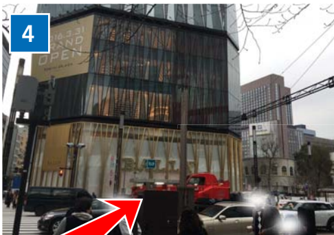
数寄屋橋交差点を東急プラザビル 方面へ渡って右へ。