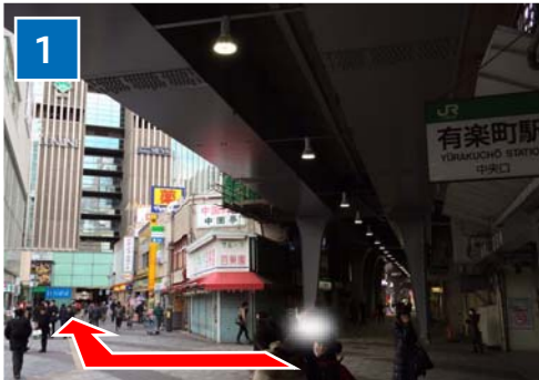
山手線 有楽町駅 中央口を出て右へ。