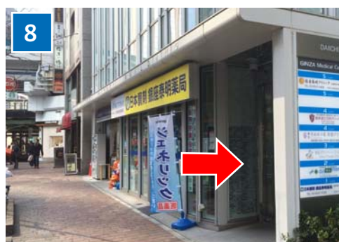
第一御幸ビル1階 日本調剤の右通路を直進し、 奥のエレベーターで3階もしくは2階の受付へ お越し下さい。