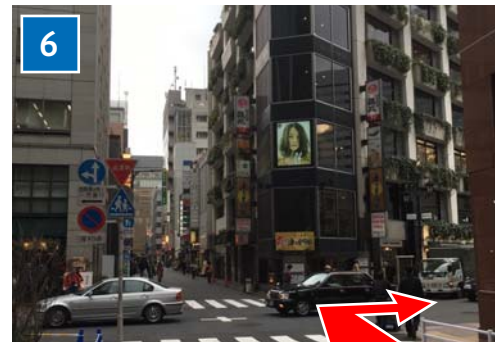
十字路を右へ曲がり「みゆき通り」へ入ります。